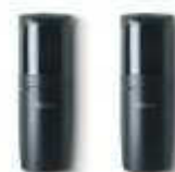
FT210 fotokomórki (para) nastawne z kątem 210°, zasięg 15 m