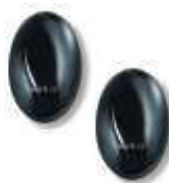
BF fotokomórka (para) zasięg 15-30m