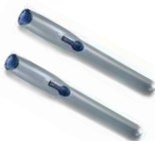
WG4000 2 siłowniki 230V