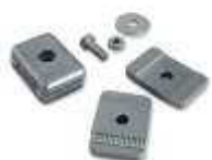
PLA 13 ograniczniki krańcowe mechaniczne przy otwieraniu i zamykaniu (4szt.)